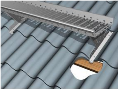
1. Plekk- ja ruberoidkatvus