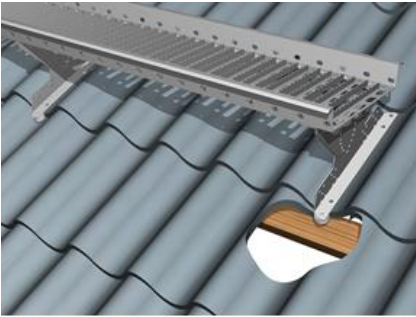
Bild 1. Plåt- och filttak