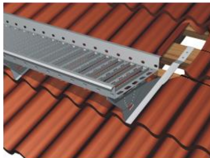
Bild 2. Tegeltak