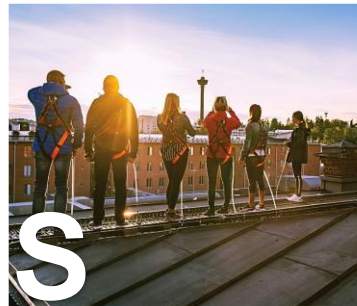
S YHTEISKUNTA- JA SOSIAALINEN VASTUU