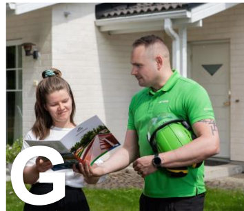
G HYVÄ HALLINTOTAPA

Vastuullisuus on yksi yrityksen kulmakivistä, jonka edistämiseen koko yritys on sitoutunut. Palveluidemme ja tuotteidemme laatua, yrityksen luotettavuutta sekä vastuullisuutta todentavat moninaiset sitoumukset ja yhteistyötahot.