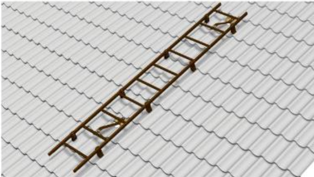
Bild 1. Plåt- och filttak