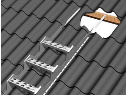
Bild 1. Plåt- och filttak Classic-tak