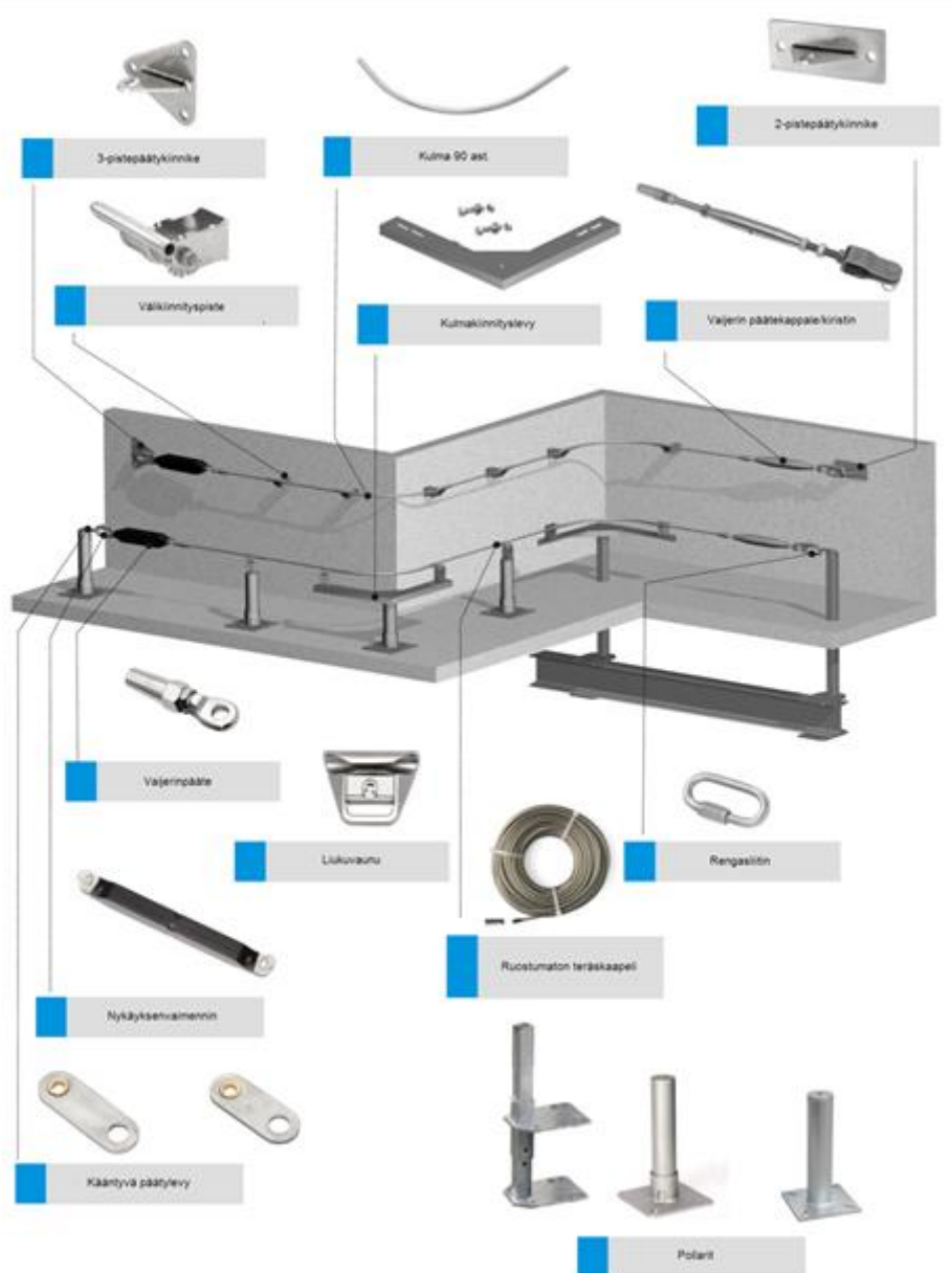
Bild 2. Systemets delar (i synnerhet vid montering i vägg och pollare).