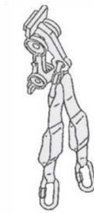
Bild 1. Fallskyddsskena